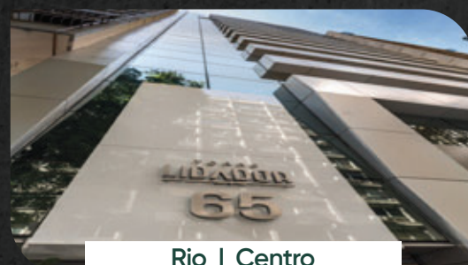
Rio | Centro