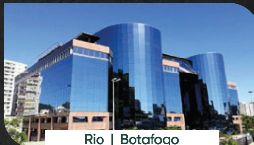
Rio | Botafogo