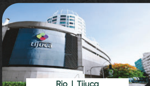
Rio | Tijuca